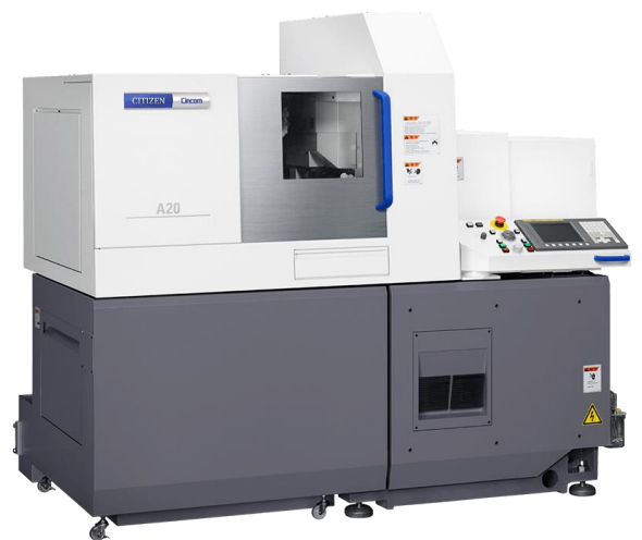
主軸台移動形CNC自動旋盤 Cincom A20