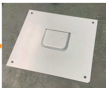
簡易金型イメージ