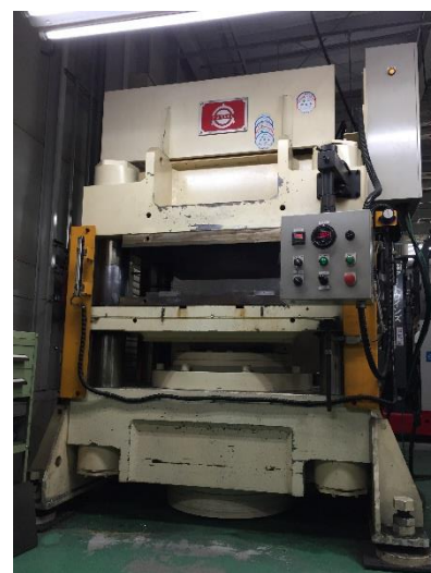
真鍋工業製 油圧500tプレス

対応形状は材質、板厚、形状配置等に影響されるので まずは一度、下記までお問い合わせ下さい。